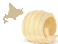
北海道産発酵バター