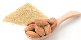
アーモンドパウダー

北海道産発酵バターを贅沢に使用した、なめらかな味わいのバタークリームに仕上げております。生地も高品質な100%のアーモンドパウダーを使用し、しっとりした食感が特徴です。